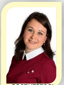
воспитатель первая кв. категория