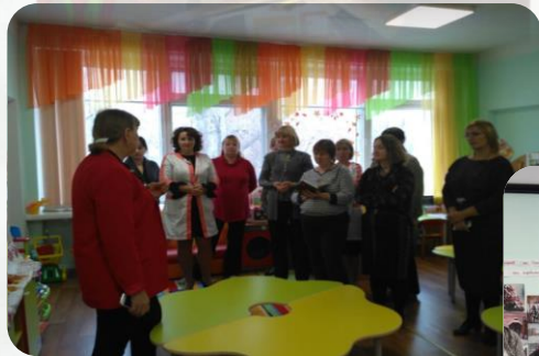
Августовское совещание педагогических и руководящих работников г. Екатеринбурга, 2018 г, 2019 г.