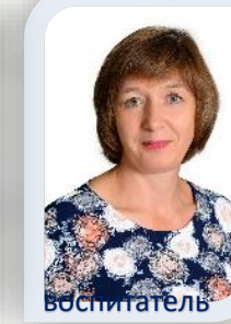
воспитатель высшая кв. категория

18 педагогов (100%), работающие в МБДОУ имеют профессиональное педагогическое образование. У 84 % педагогов - высшее профессиональное образование, у 16 % – среднее профессиональное образование. Образовательный уровень педагогических работников позволяет обеспечить организацию качественного дошкольного образования.