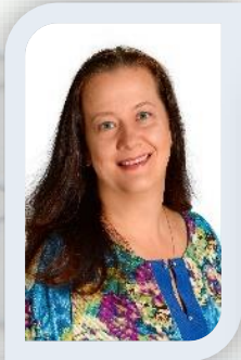
учитель –логопед первая кв. категория