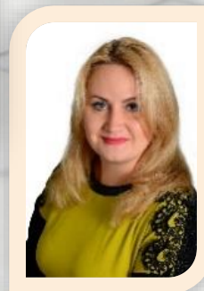
воспитатель первая кв. категория