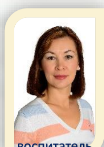
воспитатель первая кв. категория