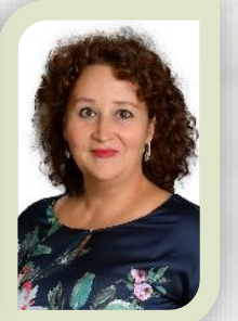
воспитатель высшая кв. категория