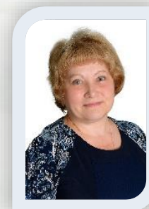
воспитатель первая кв. категория