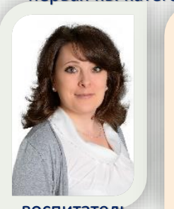
воспитатель первая кв. категория