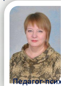
Педагог-психолог первая кв. категория