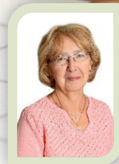
Музыкальный руководитель первая кв. категория