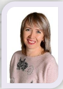
Учитель –логопед высшая кв. категория