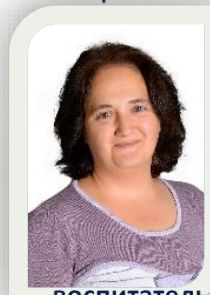
воспитатель первая кв. категория