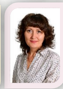
воспитатель первая кв. категория