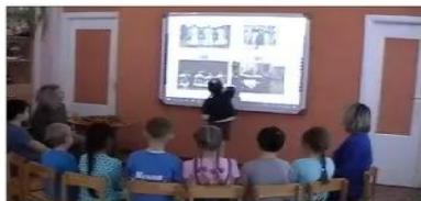
Индивидуальная работа с детьми группы ОВЗ по развитию речи