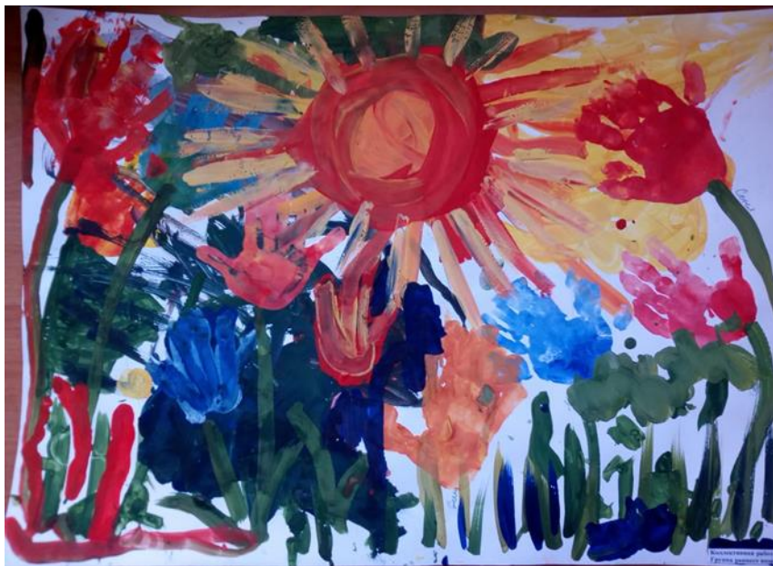
Коллективная работа группы воспитанников